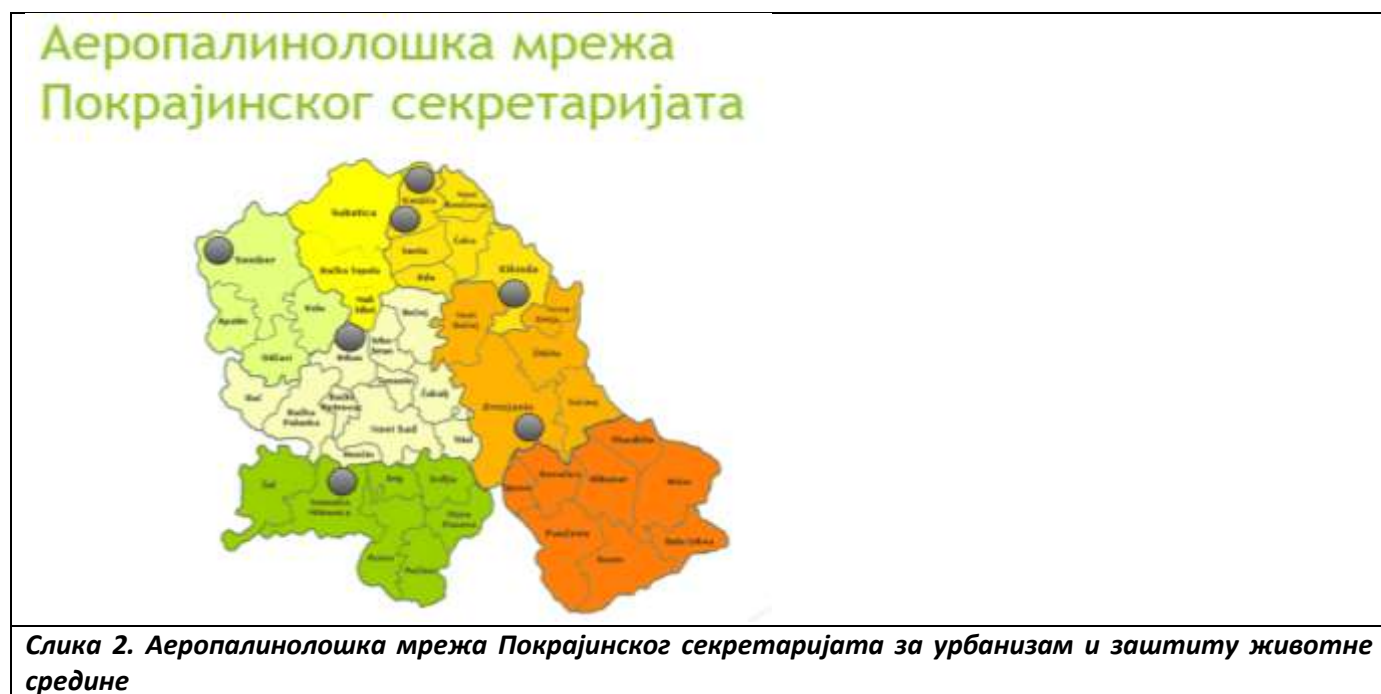
Слика 2. Аеропалинолошка мрежа Покрајинског секретаријата за урбанизам и заштиту животне средине

ПСУЗЖС финансира мониторинг алергеног полена у АПВ на 7 аеропалинолошких мерних станица (Сомбор, Зрењанин, Врбас, Сремска Митровица, Кикинда, Лудашко језеро и Кањижа), које обухватају мерења 24 типа полена (Слика . Мерења спроводи акредитована Лабораторија за палинологију, Природно математичког факултета, Универзитета у Новом Саду.