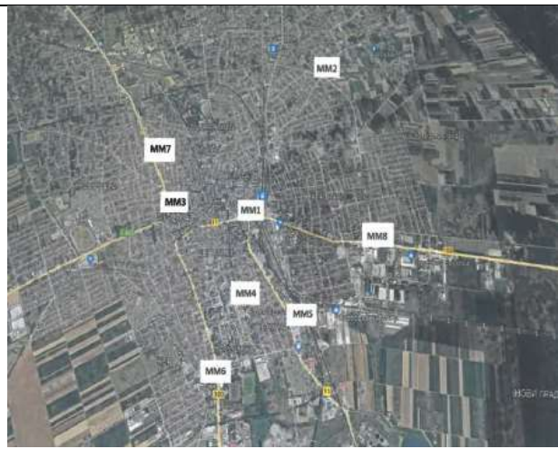
Слика 3. Расподела мерних места у Суботици