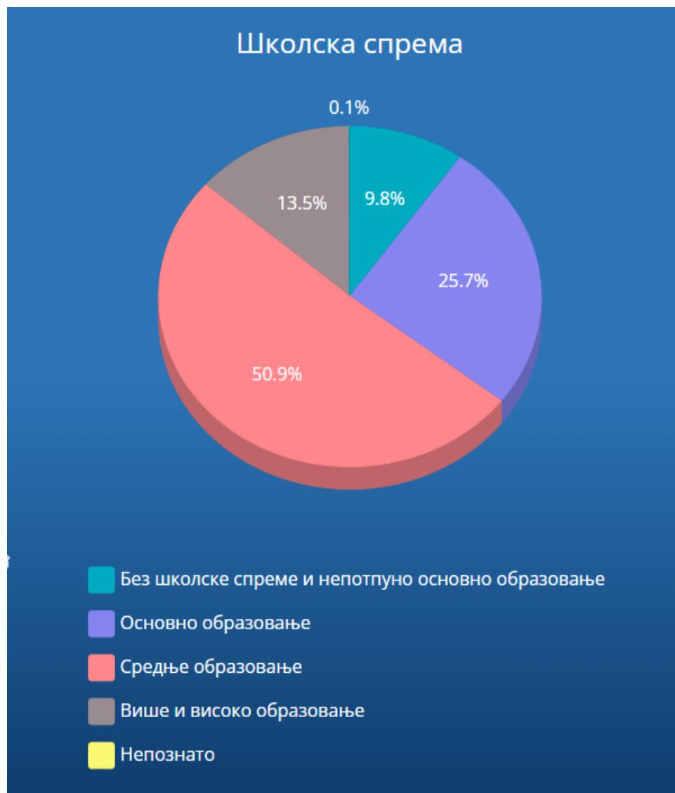
Графикон 2. Становништво општине Бечеј према степену образовања